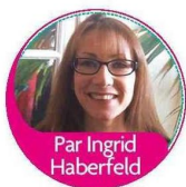
Par Ingrid Haberfeld

Avec l'âge, des ridules se forment autour de la bouche et la lèvre s'affine. Alors, quel maquillage porter ? Carine Larchet, cheffe maquilleuse, arbitre le match.